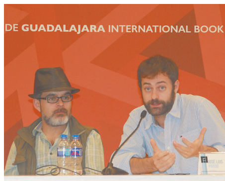
Un encuentro de periodistas