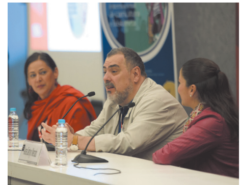
Una FIL de caricatura