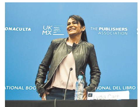
Buscando a Lydia Cacho