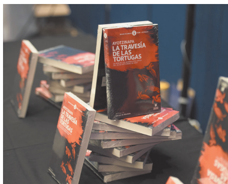
La travesía de Ayotzinapa