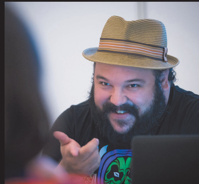
Actividades de Talent Motion Studio