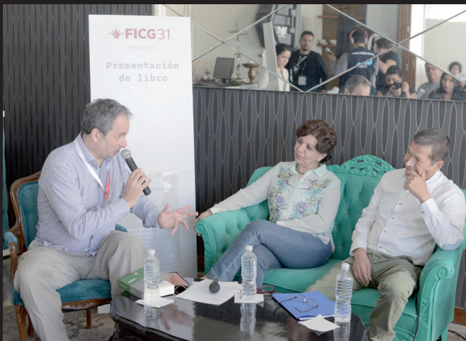
Presentación del libro Clásicos del cine mexicano