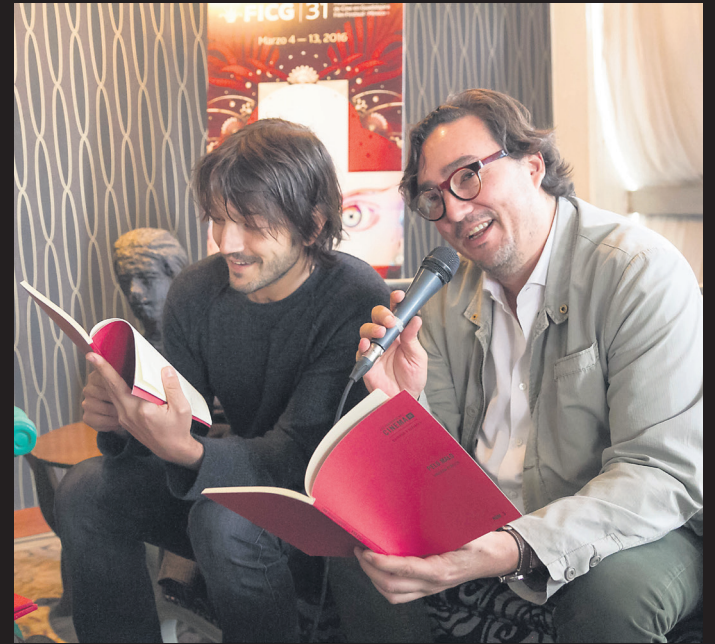
▲ El actor Diego Luna en la presentación de los Cuadernos de Cinema 23