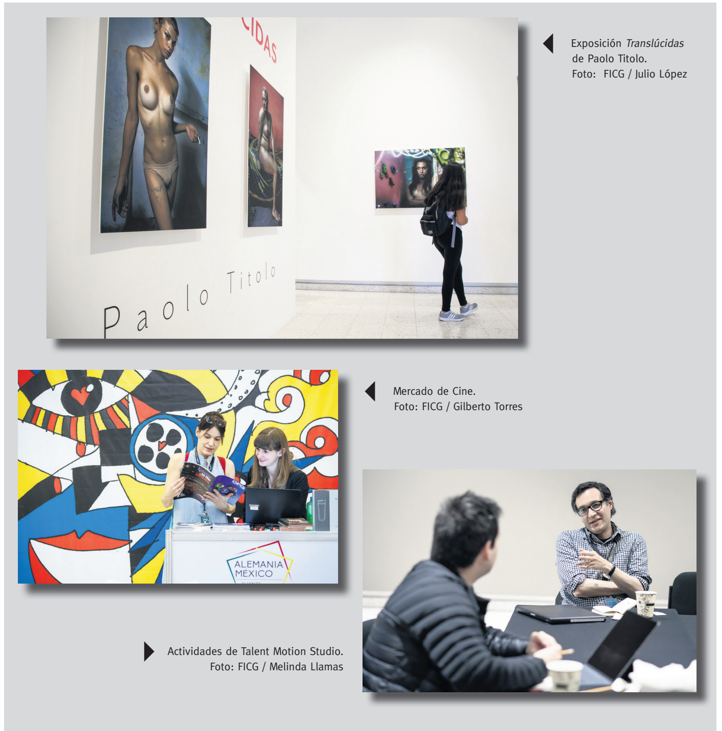
Exposición Translúcidas de Paolo Titolo.