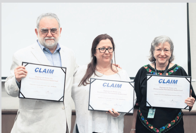
Reunión CLAIM-HOMENAJES.

AHORA PUEDES DISFRUTARLA ORIGINAL O SIN AZÚCAR