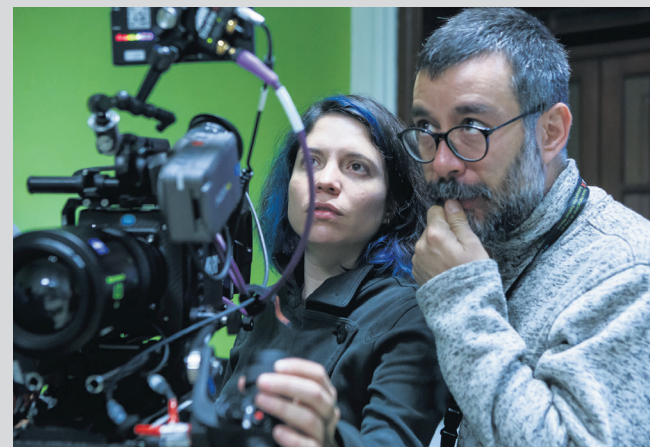
▲ Foro de Cinefotógrafos.