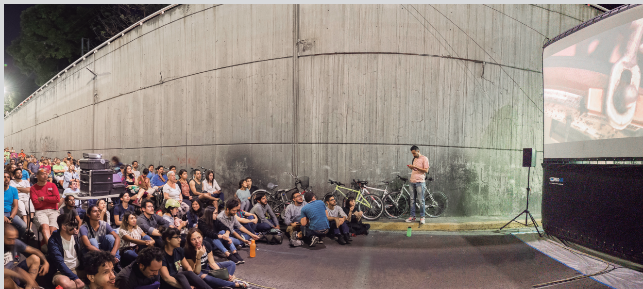
▲ BICINEMA, del director Roy Sedano, proyección al aire libre.