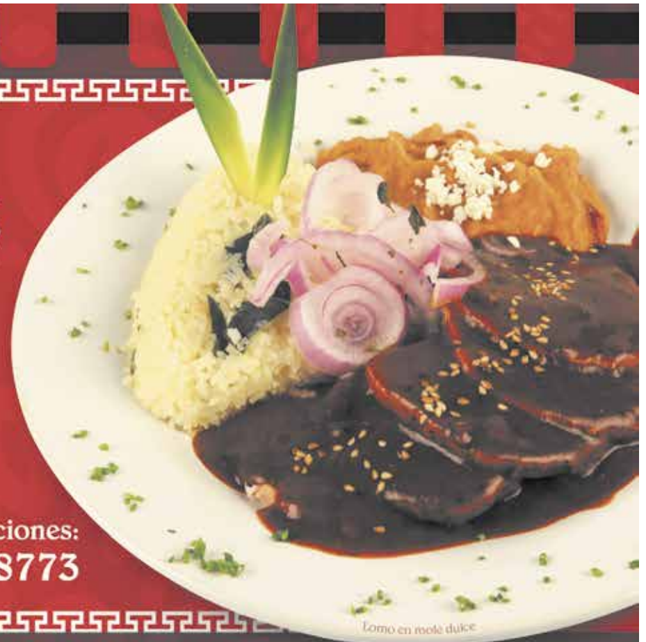
Lomo en rolé dulce