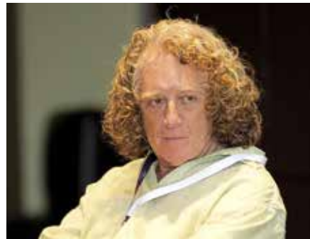
▲ Luis Mandoki